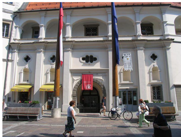
http://mb.zadrga.si:81/typo3temp/pics/02f95off3c.jpg (22. 3. 2016)