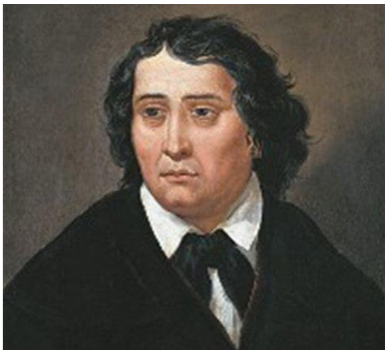
http://www.emka.si/img/product/zt_2012/povodni-moz3.jpg (15. 2. 2016)