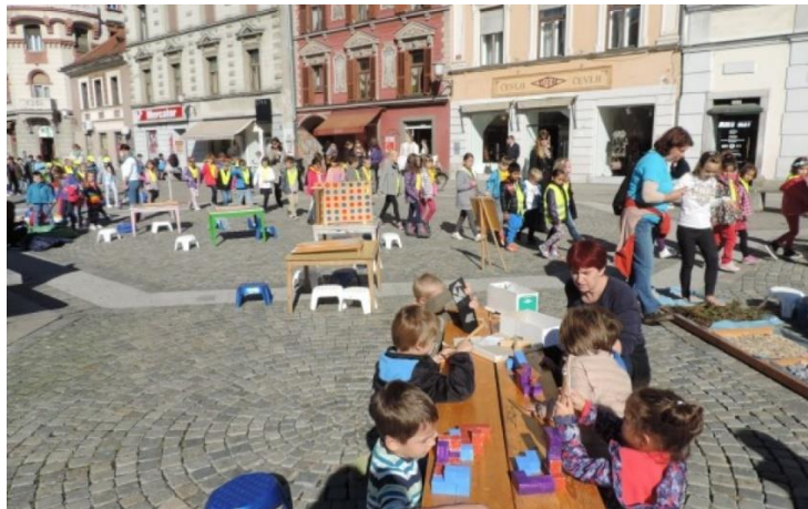
http://zpm-mb.si/galerije/teden-otroka-2015-2/ (2. 2. 2016)